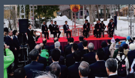
円山動物園へのゾウ誘致運動を行いゾウ舎がオープン