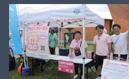
ベビーファーストフェスティバルを開催