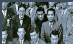
全国で18番目の青年会議所として誕生