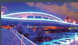
豊平川にて「川見」事業を開催