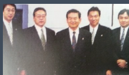
Jリーグ誘致署名運動により、コンサドール札幌設立に繋がる