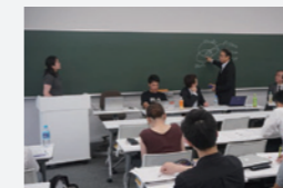
さっぽろ社会起業家 零ONE塾