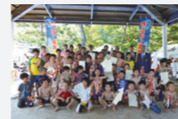
わんぱく相撲 札幌場所